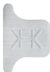
Ti - 250 PST (25 x 36)