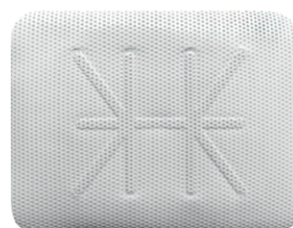
Ti - 250 K2 (40 x 50)