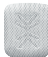
Ti - 250 PL (25 x 30)