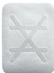
Ti - 250 XL (30 x 40)