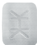
Ti - 250 PS (20 x 25)