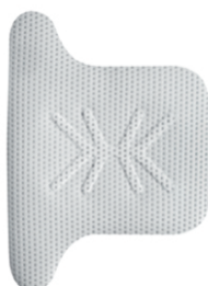
Ti - 250 PLT (30 x 41)