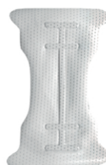
Ti - 250 ATC (24 x 38)