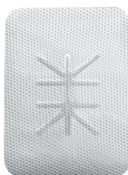
Ti - 250 XLK (30 x 40)